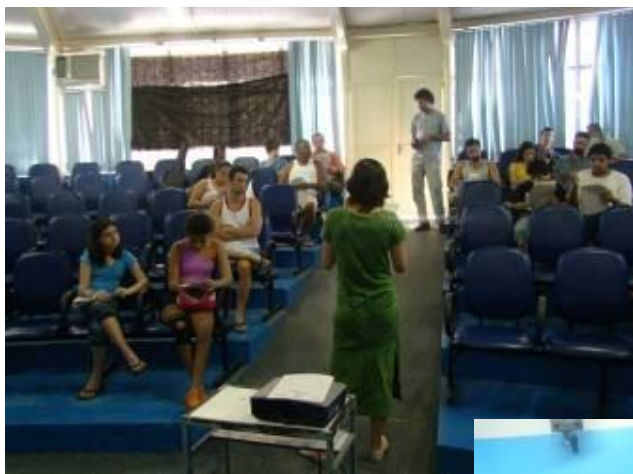
Oficina na EM Maestro Heitor Villa-Lobos

Créditos NEA/FME nos filmes produzidos, os quais estão no acervo do NEA.