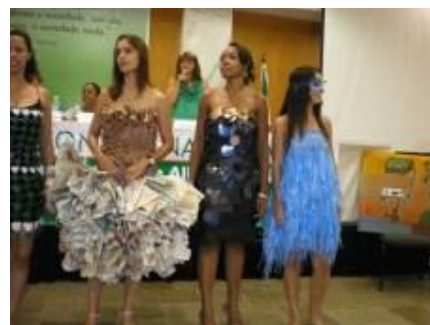
Desfile de roupas com materiais recicláveis