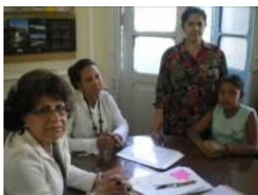
Entrega da Carta à Secretária