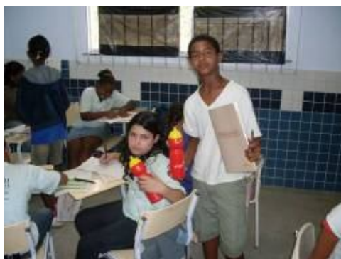
José de Anchieta – Entrevistadores