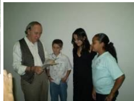
Entrega da Carta ao Ministro do MMA - Minc