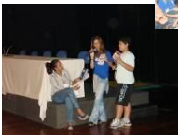
Com Leonardo Boff