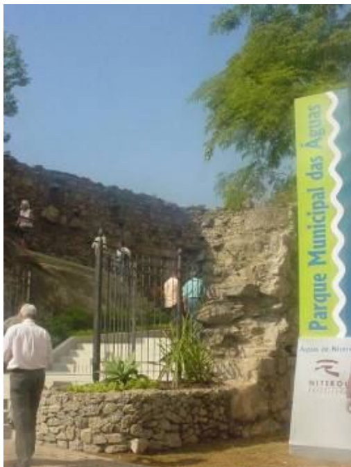
EM Ayrton Senna