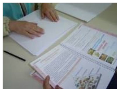
Materiais adaptados para Educação Especial