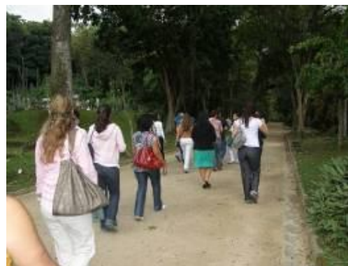
Visita ao Jardim Botânico