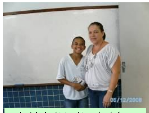
José de Anchieta – Vencedor da frase